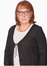
Juuli Sadrak Kinnisvara ekspert