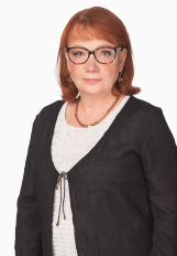
Juuli Sadrak Kinnisvara ekspert